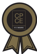
Cr. EMILIO G. PERTICARINI

Contador Público Nacional (U.N.Co.) C.P.C.E.R.N. Tº IV Fº 190